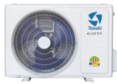
13,000 - 25,000 BTU/HR : CONDENSING UNIT