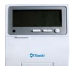
LCD WIRED REMOTE CONTROLLER