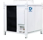
CAV 75,000 - 150,000 BTU/HR